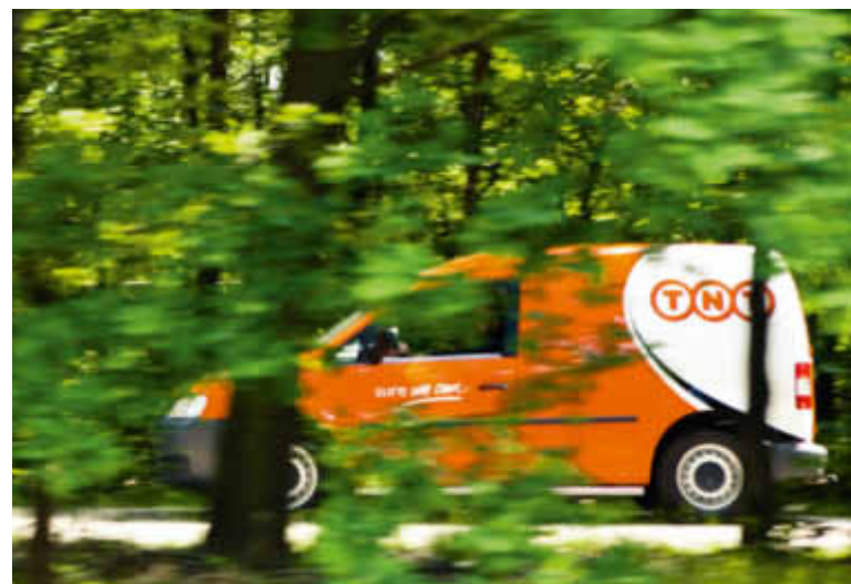
Auf dem Weg zu einem besseren Weltklima: TNT Swiss Post.

Im Rahmen von Planet Me hat für TNT Swiss Post die Umsetzung des ISO-14001-Standards erste Priorität. Ein besonderes Augenmerk gilt der Fahrzeugflotte: Die Transportfahrzeuge werden nach ihrem Treibstoffverbrauch bewertet und entsprechend eingekauft. Mit gasbetriebenen Modellen und Cargo Cycles – den dreirädrigen Elektrofahrrädern – hat die Flotte umweltfreundlichen Zuwachs erhalten. Darü-