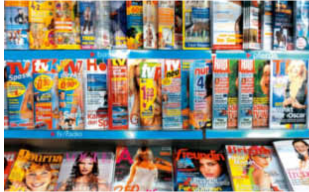
Swiss Post International sorgt für den optimalen Verkauf Ihrer Publikationen.

von Abonnenten ist, sind zahlreiche Titel vor allem am Kiosk erhältlich. Swiss Post International unterhält deshalb ein eigenes Aussendienstteam, das die Kioskbetreuung im Vertriebsgebiet der Valora AG Schweiz durchführt. Als unabhängige Partnerin übernimmt Swiss Post International die Kontrolle und Steuerung Ihres Kioskgeschäfts in der deutschen Schweiz.