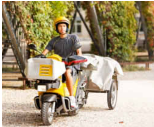
Die Post ergreift immer wieder neue Massnahmen, um die Umwelt zu schonen.

Effizienzsteigerung und Ersatz der fossilen Brennstoffe durch Energie aus erneuerbaren Quellen: In dieser Reihenfolge priorisiert die Post ihre Stossrichtung bezüglich Verbesserung ihrer Umweltwirkung. Den Restbedarf, der nicht mit erneuerbarer Energie abgedeckt werden kann, kompensiert die Post bei Bedarf mit dem Kauf von hochwertigen CO 2 -Emissionszertifikaten. Seit 2000 ist das Volumen der Personen- und Gütertransporte des Konzerns um 15 Prozent gestiegen. In derselben Periode konnte der Treibstoffverbrauch um 3,3 Prozent verringert werden. Ihren Strom bezieht die Post seit 2008 ausschliesslich aus erneuerbaren Energiequellen – hauptsächlich von Wasser-