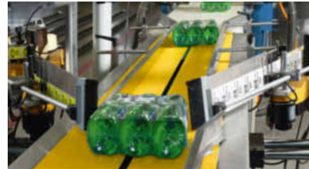
Crossdocking: Warenumschlag nach individuellen Wünschen.

Ein Beispiel: Die Mode AG möchte in ihren 30 Filialen Wintersets mit Handschuhen, Schal und Wollmütze anbieten. Sie bestellt die Einzelteile bei verschiedenen Lieferanten im In- und Ausland. Um den Rest kümmert sich die Post. Dank cleverer Informatik treffen alle Waren am gleichen Tag im Logistikzentrum der Post ein, wo sie kontrolliert und wunschgemäss umgepackt werden: Handschuhe, Schal und Wollmütze werden jeweils miteinander in vorgesehene Schachteln verpackt und an die Filialen der Mode AG geliefert. Und das innerhalb von nur 24 Stunden.